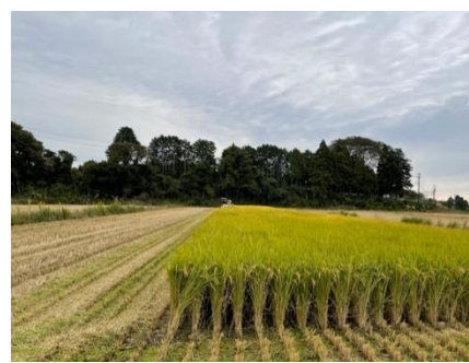
9/28 コンバイン収穫中の天のつぶ